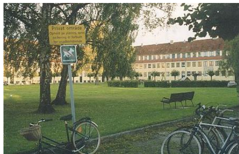
Det Gule Palæ", på Vestergårdsvej, som er det hus fra 1917 i Pipfuglekvarteret i Nordvestkvarteret i Bydel Bispebjerg.

10) Vi passerer broen over Helsingørmotorvejen , men før passagen har vi den pyramideformede Lundehus Kirke for det østlige Emdrup, et lille butikscen-ter, som erstatter butikkerne i de huse, som blev nedrevet, da motorvejen blev anlagt i begyndelsen af 1970'erne