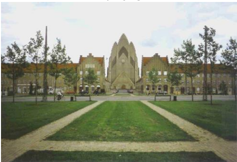
Bispebjerg Torv med Grundtvigs Kirke

Tekst og rutelægning & tekst.: Poul Lindebjerg Jensen & Christian Kirkeby, Lokalhistorisk Arkiv Bispebjerg-Nordvest 2009.