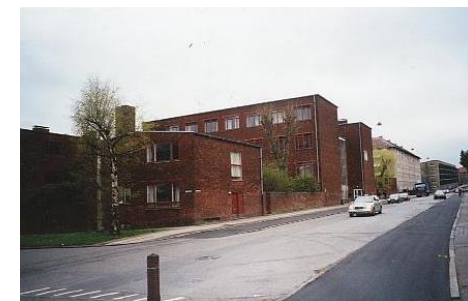
Grundtvigsskolen, nu Tagensbo Skole Facaden mod Grundtvigskirken.