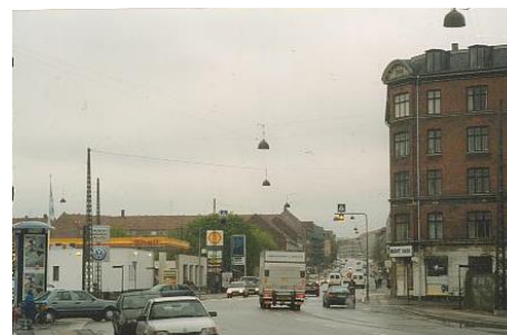
Frederiksborgvej ved Rentemestervej

13) Ved krydset Emdrupvej, Tuborgvej er der mod øst Emdrup Sø med Em-drup Søpark . Søen har siden Chr. 4 været et vigtigt drikkevandresoir til Køben-havn i flere hundrede år, og vand herfra blev ført ind til Byens Springvand, og Rosenborg m.fl., der kunne betale, i udhulede træstammer. De kaldtes "Spring-vand", i modsætning til "pumpevand" fra søerne, der ikke var særligt rent. Em-drup Søpark fra 1925 er den første park belagt med byplanvedtægt. Emdrup Sø er opdæmmet og har tilløb fra Utterslev Mose & Gentofte Sø. Afløb til Lersøom-rådet og videre ind til Søerne i omkring Indre By. Mod vest har vi Emdrupborg , der i dag Rummer Danmarks Pædagogiske Universitet. Det nuv. Emdrupborg er bygget af tyskerne under krigen. Mod syd har vi resterne af poppelalléen fra den oprindelige lystejeendom fra 1700-tallet, som opr. hed Emdrupgård og Annalyst.