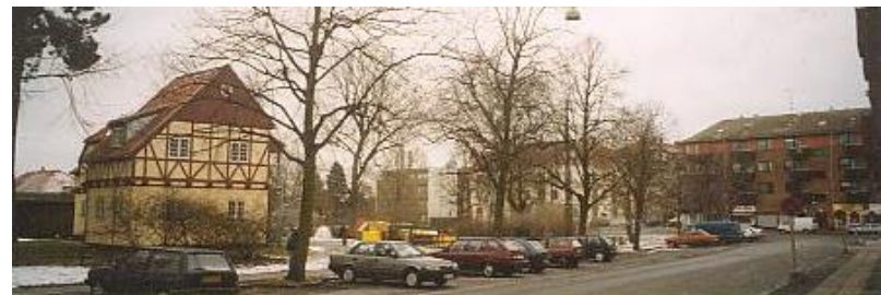
Utterslev Torv med Børnekulturhuset Sokkelundlille i forgrunden tv. Var kgl. Jagthytte for Christian d. 7,

24. Lygten Stationsbygning blev bygget i 1906 for jernbanen til Slangørup. 1976 blev banen omlagt til Svanemøllen Station og bygning stod tom til 2001 da Kvarterløft Nordvest og Bispebjerg Miljøcenter rykkede ind. Frederikssundsvej fra Mågevej til Højbanen er Nordvests butiksstrøg