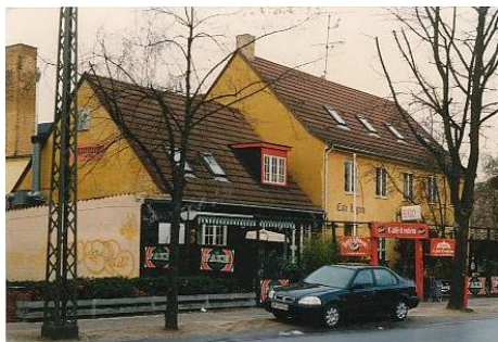
Lygtekroen på Lygten, eneste hus tilbage fra 1930'erne af Folmer Bendtsens motiver

27. Bispebjerg Kulturcenter: Ad Hovmestervej passerer man den sydlige sigtlinie til Grundtvigskirken, og passerer Grundtvigsskolen som blev bygget i 1937-38 som en moderne aulaskole med boldbaner på græs. På hjørnet at Tagensvej og Bispebjerg Bakke ligger Bispebjerg Kulturcenter, hvor de 2 barakker blev opstillet i 1948 som børnehaven og i 1949 som "ungdomsbarkken". Begge bygninger fungerede som medborgerhus det første i København, hvor man især med boligselskabet FSB's ungdomsklubber tacklede ungdomsproblemerne i opløbet efter krigen. Tagensvej 188 også børne- og ungdomsinstitutioner kom i 1958 og Bispebjerg Bakke 6, børne-omfatter det offentligt tilgængeligt parkareal på grunden, som skal hænge sammen Kommunes store områder af den slags og den bedst velordnede. Der har været kolonihaver siden 1. verdenskrig.