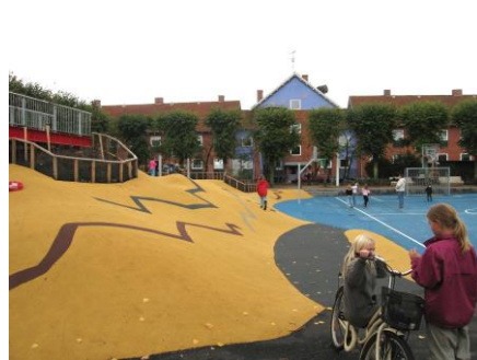
Legepladsen "Pipperen" mellem Nattergalevej og Rørsangervej