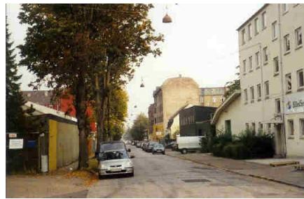
Rentemestervej set mod Provstevej Tekno Legetøjsfabrikken var th. set Peter Ipsens Alle.