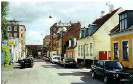
Thoravej v/Provstevej Den røde gavl er bygning med gendamerne Hjørnehuset med tårnet skal i fremtidens ses i Århus i Den gamle By

Tekst og rutelægning: Christian Kirkeby, Lokalhistorisk Selskab 2009.