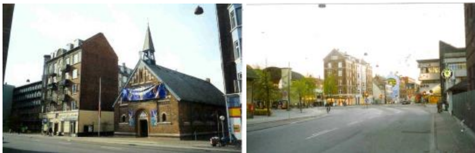
Kapernaums Kirke på Frederikssundsvej

Tekst og rutelægning: Chr. Kirkeby, Lokalhistorisk Selskab 2009