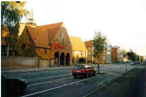
Mågevej med Ansgarkirken

Tekst og rutelægning: Chr. Kirkeby, Lokalhistorisk Selskab 2009