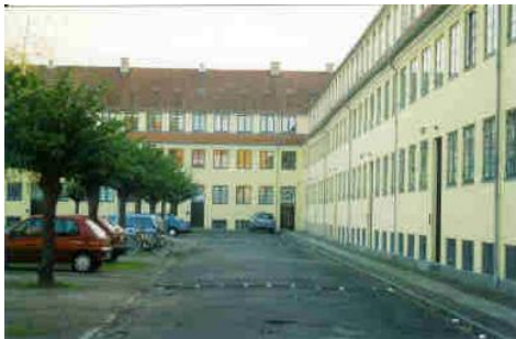
Det gule Palæ på Vestergårdsvej.