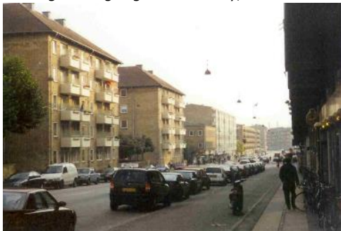
Frederiksborgvej mod Landsdommervej

tekst og rutelægning.: Chr. Kirkeby, Lokalhistorisk Selskab 2009.