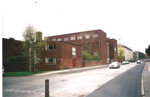
Grundtvigsskolen med i sigtelinie til Grundtvigskirken. Kvarterets hovedakse, symbolsk. Nu hedder Tagensbo Skole.