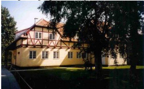
Børnekulturhuset Sokkelundlille på Utterslev Torv

tekst og rutelægning: Chr-Kirkeby, Lokalhistorisk Selskab 2009