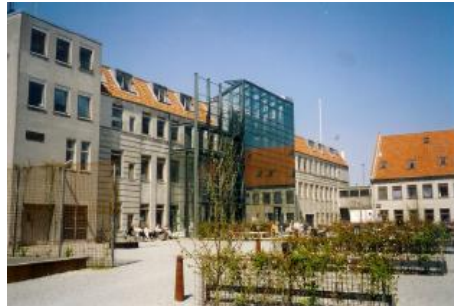
Kulturhuset bispebjerg nordvest, Tidligere Kvartercentret Nordvest