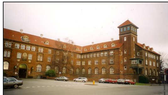
Bispebjerg Hospital, hovedindgangen Administrationsbygningen.