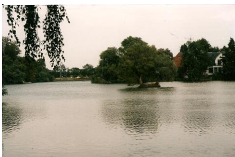
Emdrup Sø set fra Søborghusrenden.