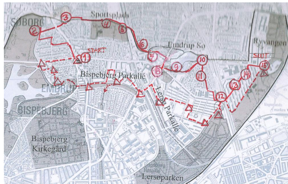
Den punkterede rute er guidede tur Emdrup II

Tilrettelagt af: Lokalhistorisk Arkiv Bispebjerg-Nordvest i Lokalhistorisk Selskab for Brønshøj, Husum og Utterslev i Kulturhus Bispebjerg-Nordvest, Tomsgårdsvej 35, og Agendaforening Nordvest, i Karens Hus, Bispebjerg Bakke 8, 2400 København NV.